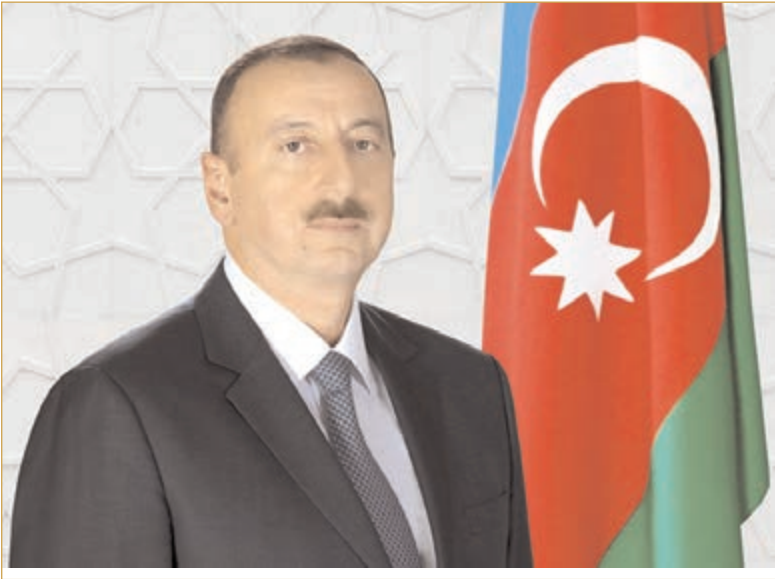
Möhtərəm Prezident, Müzəffər Ali Baq Komandanı!

Bu gün Sizin yüksək idarəçiliyiniz, qətiyyətiniz və bacarığınız, xalqımızın siyasi iradəsi, Ordumuzun gücü və qüdrəti sayəsində 30 illik işğala son qoyulur. Dağlıq Qarabağ münəqşəsi Azərbaycanın Böyük Qələbəsi ilə başa çatdı. Azərbaycan öz ərazi bütövlüyünü bərpa edir və biz tarixi torpaqlara